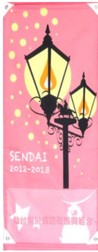
第十七回 関谷 美来(高校生)平成24年