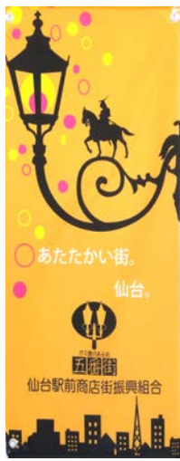
第十八回 三浦 和葉(高校生)平成25年