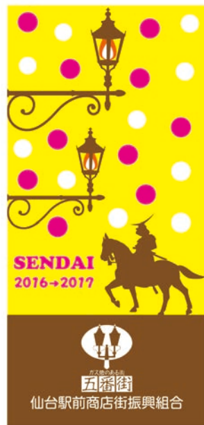
第二回 月岡 奈々(学生)平成28年