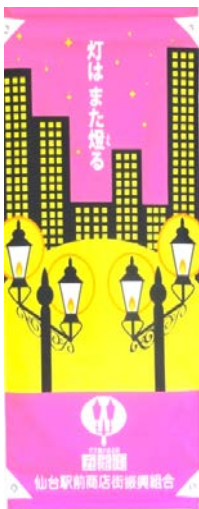
第十六回 柳 匡成(学生)平成23年